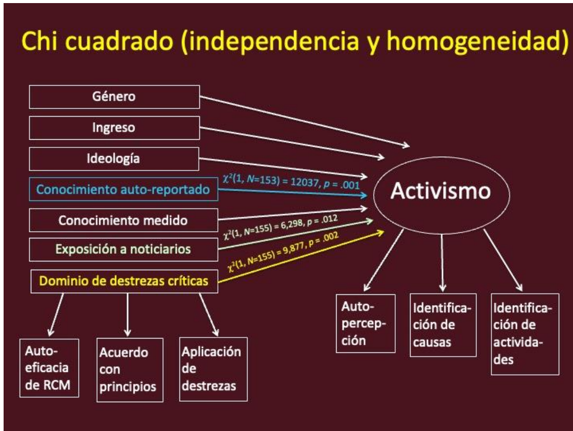
Figura 2. Prueba de Chi cuadrado de la relación entre dominio de destrezas críticas y activismo.

La Tabla 1 presenta los datos relacionados con la pregunta sobre el tipo de activismo que predominaba entre los estudiantes.