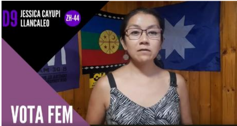
Imagen 3. Movimiento Pueblos Originarios.

algunas ocasiones, candidaturas –por fuera de los escaños- de personas mapuche, quedando visible aquello en los apellidos y simbolismo de las y los candidatos.