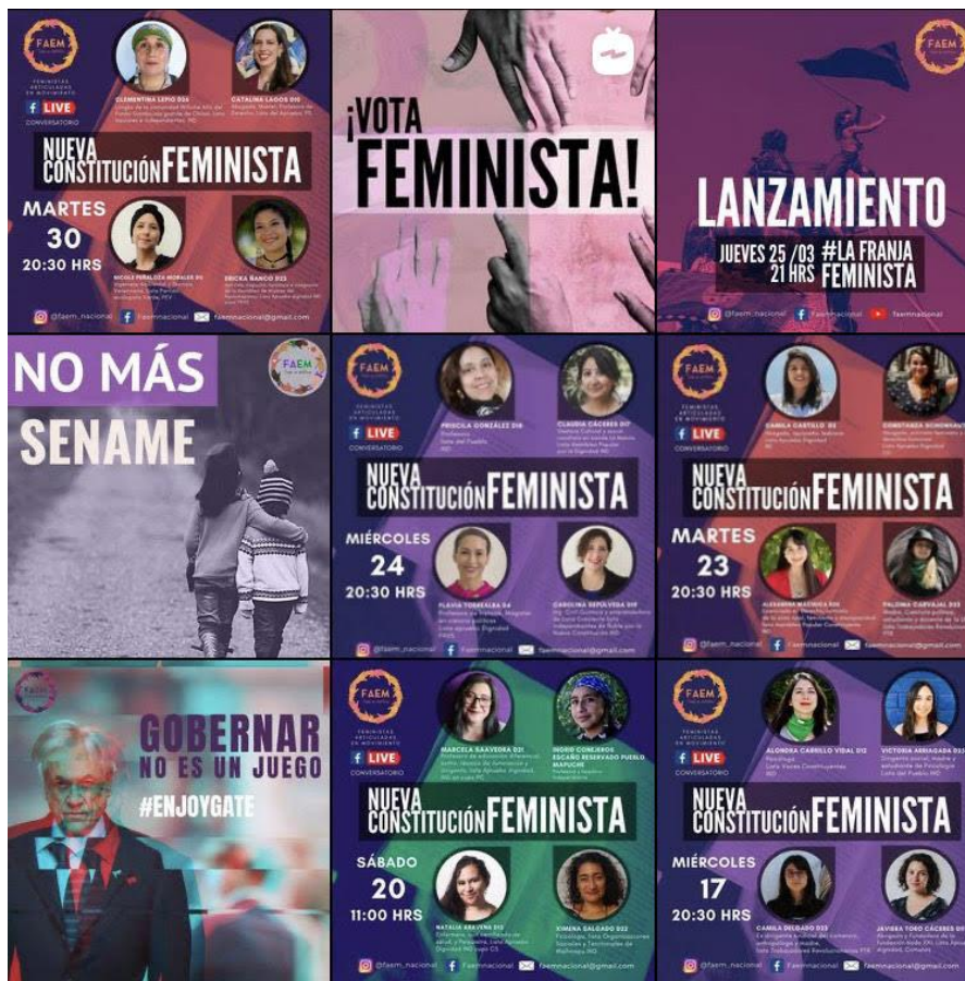
Imagen 1. Movimiento de mujeres feministas. Fuente: Instagram @faem_nacional .

electoral en un formato tradicional que aborda a la mayoría de las mujeres que cumplen con los requisitos mencionados a nivel nacional de los 28 distritos, donde las candidatas podían dar a conocer un pequeño mensaje de campaña, su distrito y su lista, y fueron contactadas directamente desde FAEM. Es importante destacar el contenido de calidad, sumando la preparación y gestión profesional en aspectos técnicos y prácticos, donde por un periodo determinado mantuvieron la franja con publicidad en redes sociales. También a través de este espacio se realizaron conversatorios con y entre candidaturas a nivel nacional, con transmisiones en vivo a través de sus plataformas. Tanto en la franja, sus conversatorios y redes sociales se observa una interseccionalidad en los aspectos que se relevan: infancia, juventud, diversidad, medio ambiente, territorio.